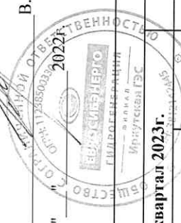
График производства работ на объекте филиала Иркутская ГЭС